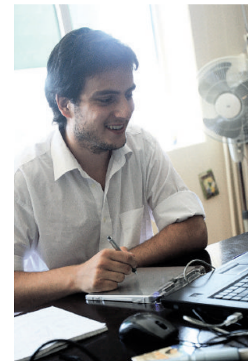
Mathijs Konings