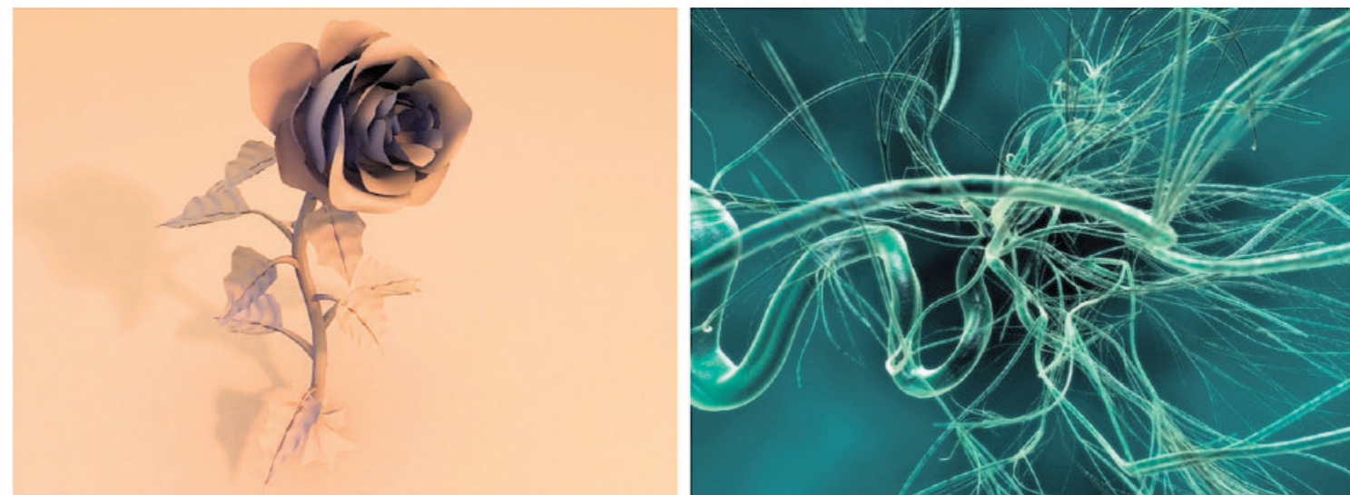
Schetsen, art work en inspiratie voor de artistieke game-in-ontwikkeling 'Bohm' van Monobanda. Zie meer op monobanda.nl