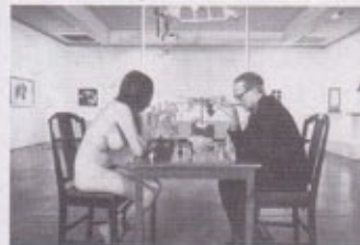
Marcel Duchamp achter het schaakbord

Al sinds honderd jaar grijpen kunstenaars naar spel en spelvormen bij de productie van hun kunst. In dit overzicht enkele bijzondere voorbeelden van meester-schaker en kunstenaar Marcel Duchamp tot aan jonge gameontwerpers uit Utrecht.