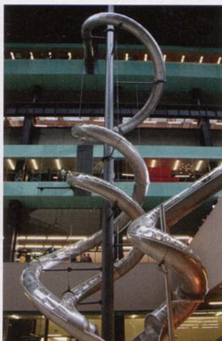
Carsten Höller, Test Site , 2006, installatie in de Turbine Hall, Tate Modern, Londen