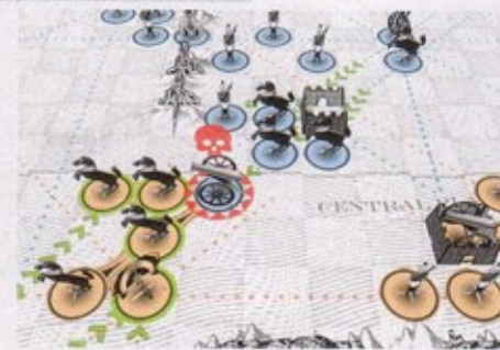
Kriegspiel van de Radical Software Group