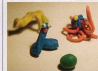
Monobanda, kleiresearch voor Mimicry , 2009, foto Simon van der Linden

- Cory Arcangel Depreciated Nederlands Instituut voor Mediakunst, Amsterdam 19 augustus t/m 14 november