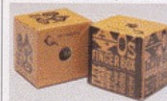
George Maciunas. Ayo's Finger Box. 1964

Het computerspel Kriegspiel is te vinden op: http://r-s-g.org/