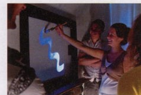
Monobanda, Interactief schilderij , 2008