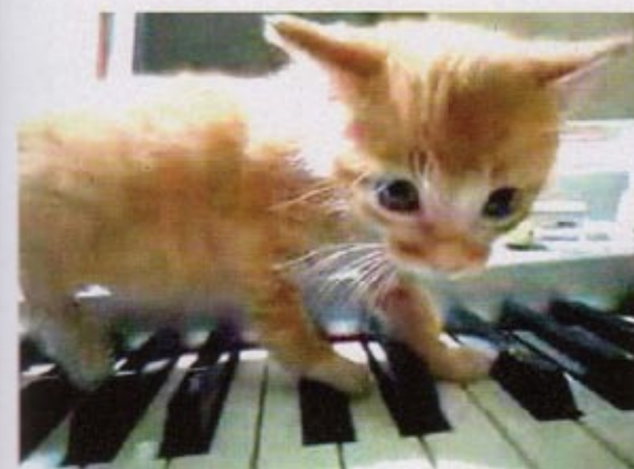
Cory Arcangel, Drei Klavierstücke, op. 11 , 2009