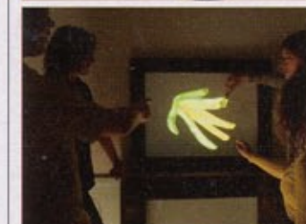
Monobanda, Interactief schilderij , 2008, foto Niki Smit