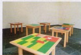
Meschac Gaba, Salle de jeux , 1999

gaan alle spelletjes van Fluxus over sociale ordes en regels in de samenleving en de kunst.